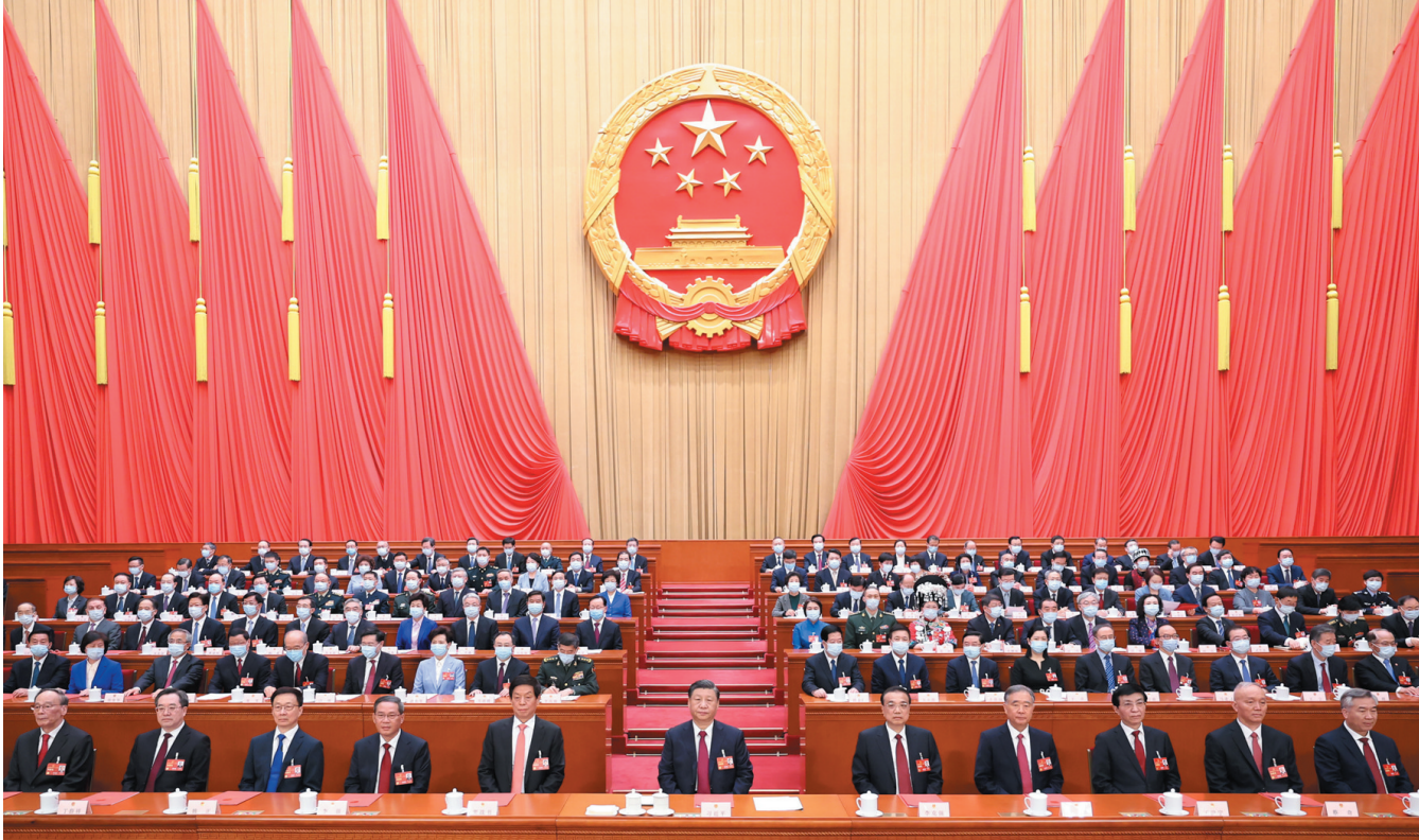
3月13日，第十四届全国人民代表大会第一次会议在北京人民大会堂闭幕。习近平等党和国家领导人在主席台就座。