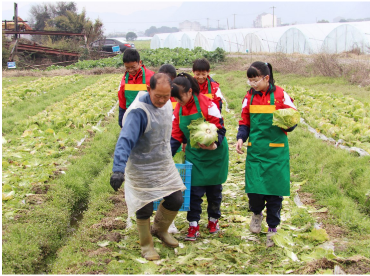
学生帮忙采收大白菜。

本报讯(记者姚天 通讯员江文辉文/图)“您好, 我们从温岭发布上看到着横大白菜滞销, 我们想订购3000斤!”“我们从朋友圈看到别人转发的微信, 种植户们种点菜不容易, 给我来1万斤。”……2月16日, 温岭发布推送消息《急急急! 大白菜丰产却滞销! 0.3元一斤, 盼大家搭把手》后, 市融媒体中心新闻为民小虎队的电话就被打爆了!