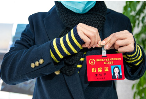
人大代表郑重佩戴大会出席证。

代表们纷纷表示，未来几天里，将以高度的责任感和使命感，认真履职尽责，积极反映基层心声和社会热点、难点问题，切实当好 群众代言人，用实际行动书写人大代表的使命与担当，为温岭经济社会发展建言献策、贡献力量。