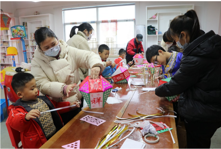
小朋友及家长共同制作趣味小花灯。

可爱的兔子凿纸图案被贴在花灯的灯壁上。期间，小朋友们充分发挥想象力和创造力，在家长的帮助下，将绘画、剪纸技艺融入花灯制作，制作出各具特色的童趣花灯，十分吸引眼球。我在花灯上面贴上兔子图案和福字，特别适合兔