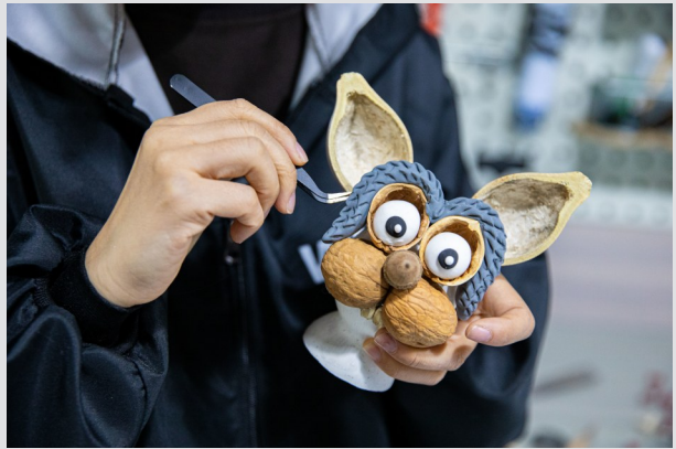
元多多用葫芦和坚果壳等材料制作的兔子摆件。