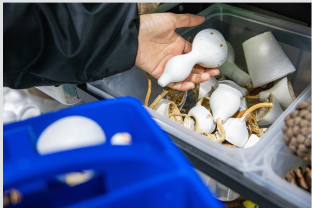
葫芦不仅可以做成兔子的脑袋，也可以做成兔耳朵。