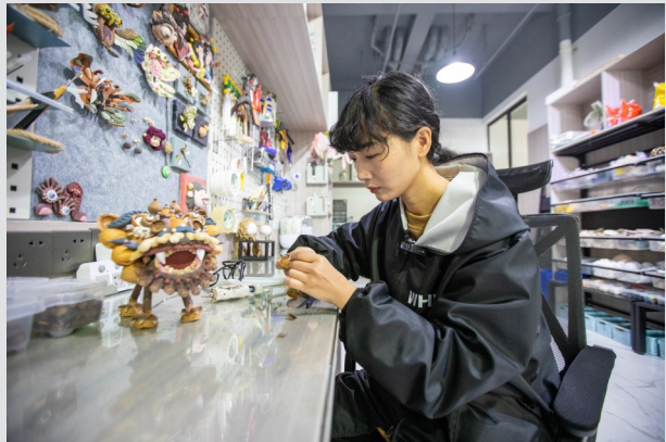
元多多正在工作室制作手作品《年兽》。