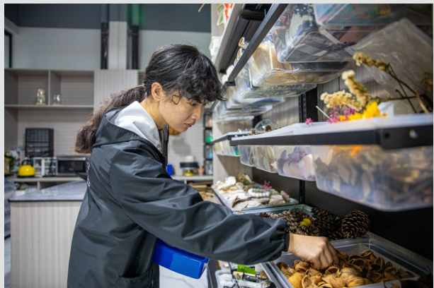
元多多正在挑选废旧材料进行创作。