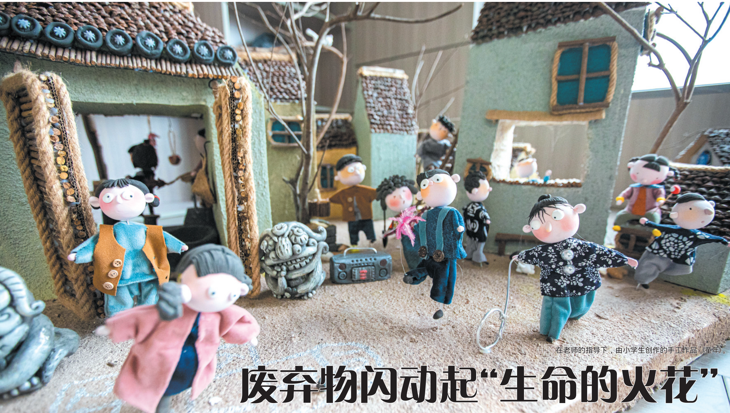
在老师的指导下，由小学生创作的手作品《童年》。