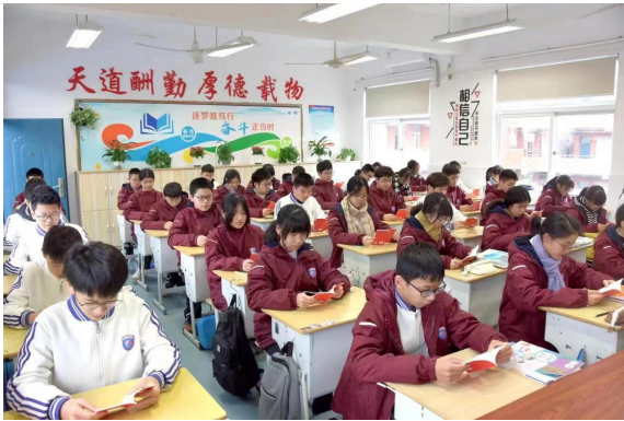
诵读宪法。