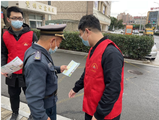
法律法规知识宣传。