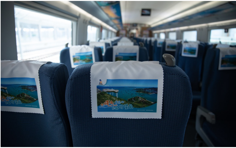
列车内展现温岭特色“旅游名片”。

本报讯（记者赵碧莹/文 章毅/图）12 月 15 日 13 时 09 分，温岭旅游冠名列车带着满满的“温岭元素”正式从温岭站出发。