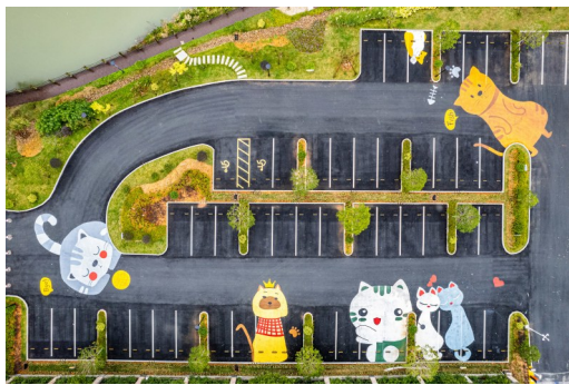
绘满了各种卡通形象的停车场。

今年以来，市环境综合整治事务中心会同市公安局、港航口岸与渔业局等部门，对非法捕捞现象进行联合执法13次，公安刑事立案19起，强制措施26人，移送起诉24人。