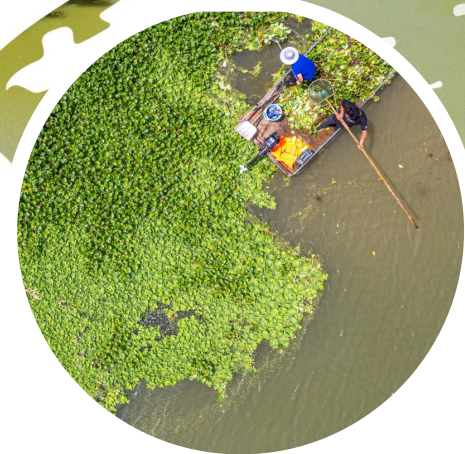
来自民间的护水队伍正在进行河道清理、水草打捞等作业。