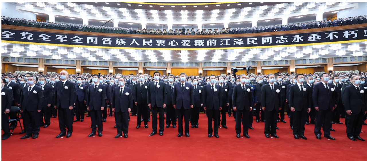
12月6日，中共中央、全国人大常委会、国务院、全国政协、中央军委在北京人民大会堂隆重举行江泽民同志追悼大会。习近平、李克强、栗战书、汪洋、李强、赵乐际、王沪宁、韩正、蔡奇、丁薛祥、李希、王岐山等参加大会。