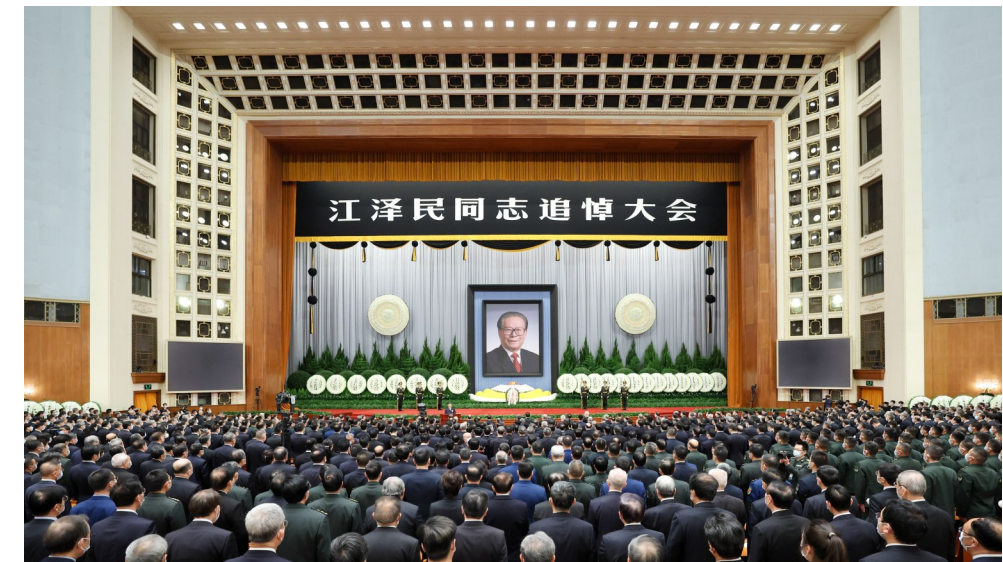
12月6日，中共中央、全国人大常委会、国务院、全国政协、中央军委在北京人民大会堂隆重举行江泽民同志追悼大会。