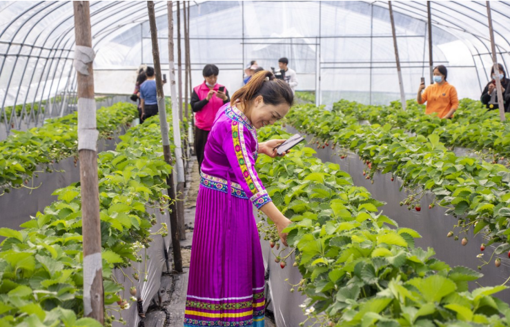
十余名妇女在城南营田村的草莓园里参观学习。

“此前，我们还开办了非遗传承人传授糕点制作技艺等培训课程。”城南镇妇联相关负责人