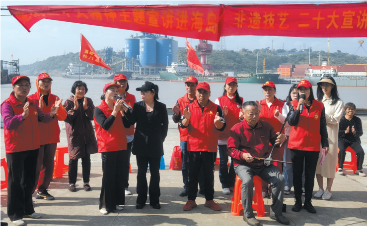
音、乡情非常浓厚。江恩春说，党的二十大召开后，他以道情、莲花调和排街等形式，到温岭的山村海岛宣传二十大精神，这种