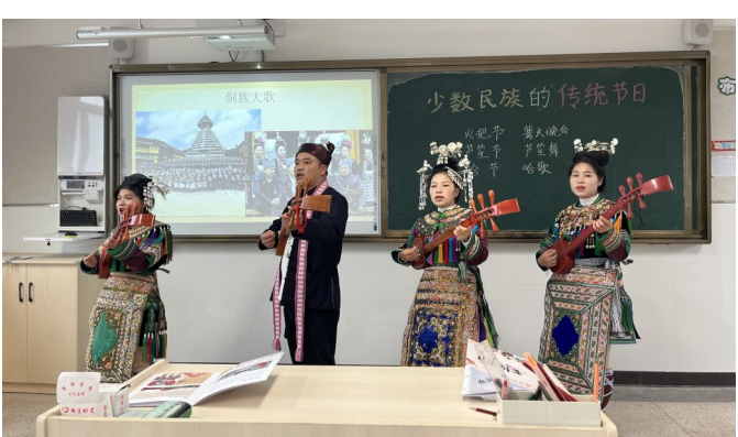
侗族家长进课堂弹奏五弦琵琶。

一直以来，长屿小学十分重视民族团结教育。学校专门开发了 石榴花开 校本课程，从不同地区、不同民族、不同年龄阶段的身心发展特点出发，每周开设一节民族课程，科普 民族概况 民族风俗 民族文化 知识。同时，学校还通过校园广播播放民族歌曲、宣传民族知识，积极开展民族英雄故事擂台赛，学生们用自己的语言和方式，讲述了各民族的英雄故事，充分感受各民族文化，增强爱国情怀。