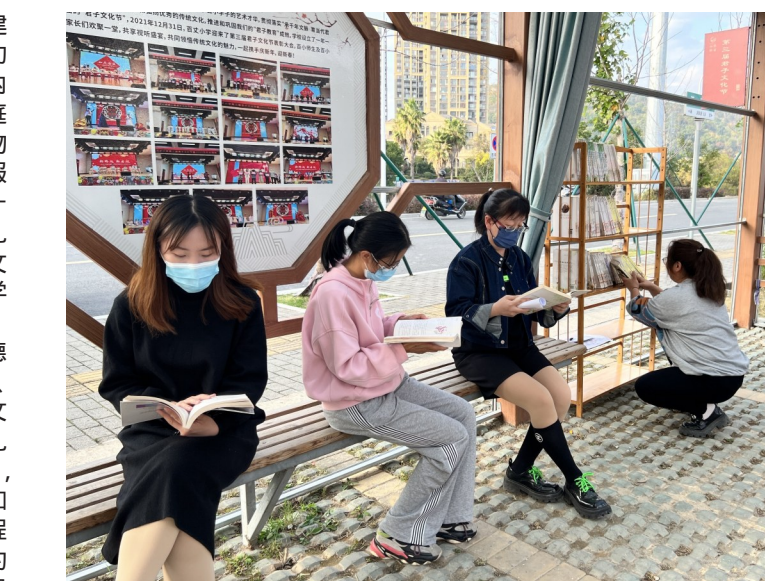
家长在百丈小学校门口的 有礼小站 翻阅书架藏书。

今年以来，市教育局围绕立德树人根本任务，坚持以德为先、多措并举、务实创新，持续推进文明校园创建工作。各学校以 有礼小站 的建设为契机，以点带面，因地制宜，利用学校的自然环境和建筑布局，解决文明校园创建过程中的痛点难点，实现了校园环境的全面优化升级和文明指数的不断提升。