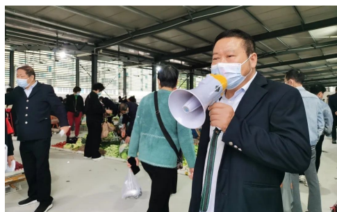
工作人员手持扩音喇叭，随时提醒菜贩及买菜市民注意佩戴口罩。