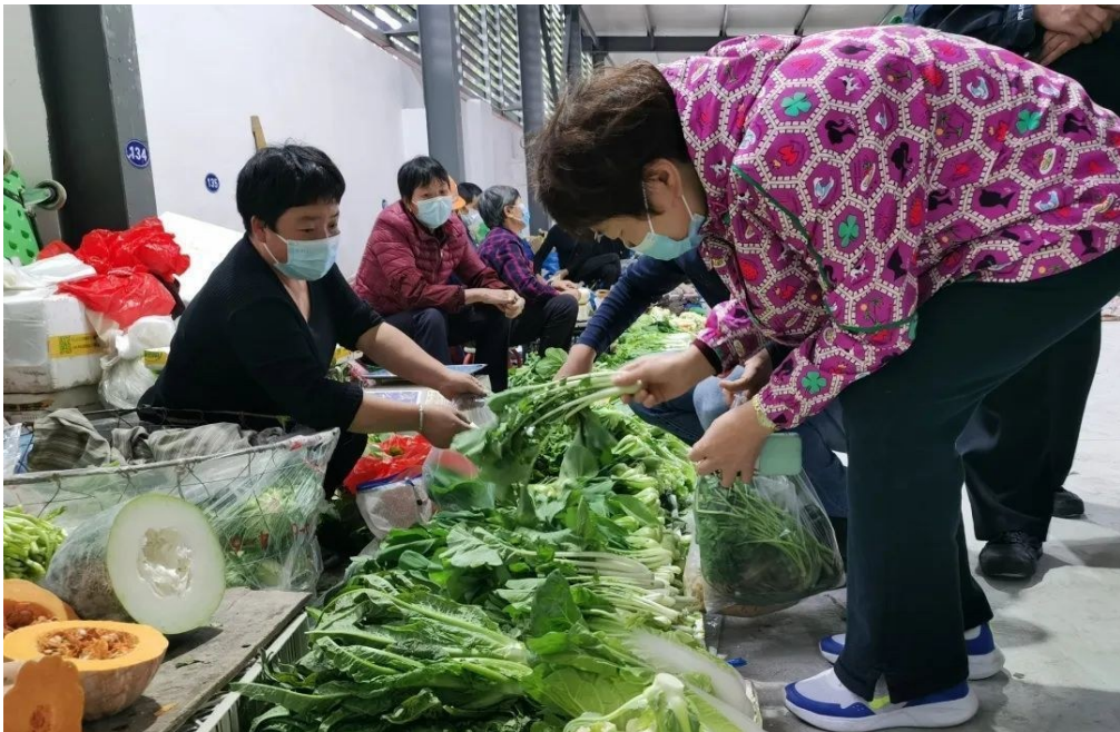
搬到新址第一天，自产自销点生意仍非常红火。

农副产品自产自销点不同于正规菜市场，疫情防控难度较大。为了切实抓好自产自销点的防疫工作，从早上7点开始，北山村就安排值勤人员在两个入口处值勤，每个入口处都安排两至三人把守，进入自产自销点的市民不但要佩戴口罩，还要扫台州畅行码，测量体温。一位工作人员手持扩音喇叭，随时提醒菜贩及买菜市民注意佩戴口罩。