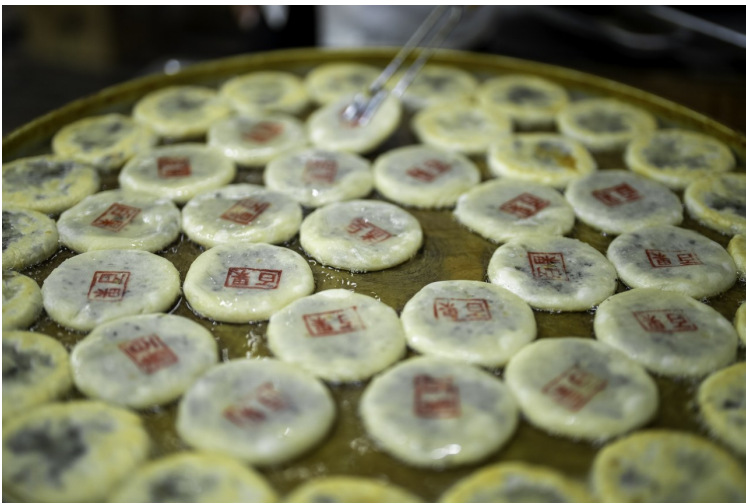
夜幕降临，街上弥漫着各色美食的味道。