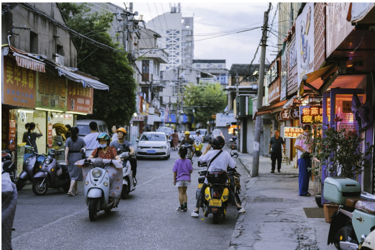
贪吃街街面狭窄，道路两侧店铺却排得满满当当。