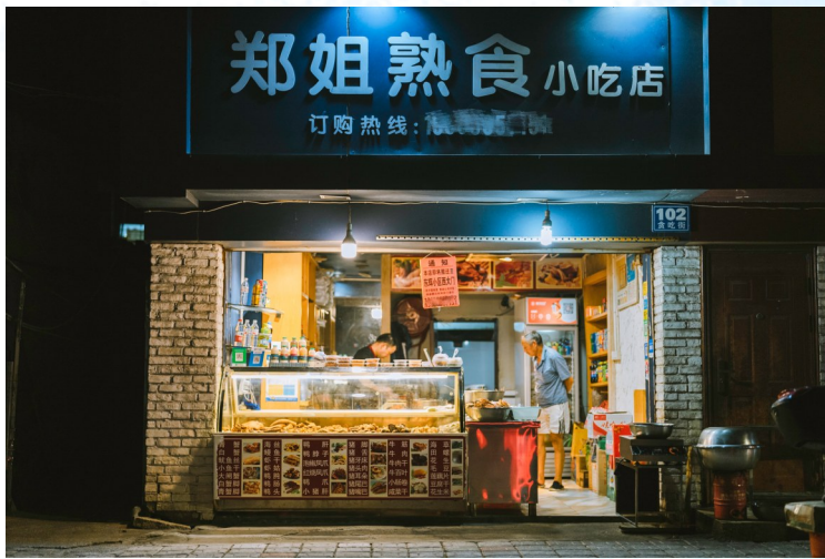
几乎每家店面都贴上了搬迁通告，新店地址等信息一应俱全。