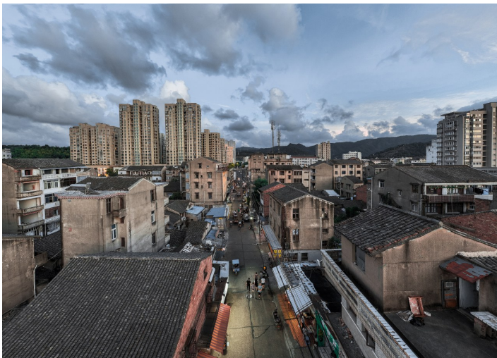
太平街道启动东门路A、B、C区块等八大区块改造，贪吃街被列入征迁范围。