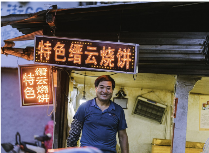
这条街巷，承载了太多人儿时的回忆。