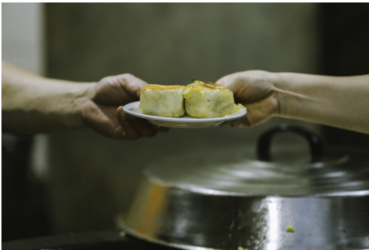
市民们前往贪吃街打卡，用自己的方式作最后的告别。