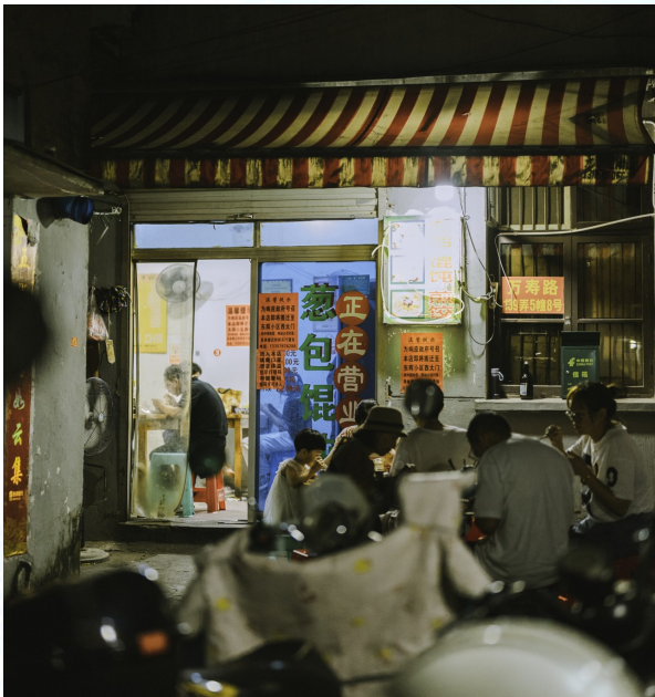
顾客在吃葱包的同时，还不忘拍照留念。

温岭城市建设离不开旧房的拆迁，这既是对居民生活环境的改善，也是城市形象的大提升。贪吃街曾是这座城市繁荣的印记，是精神文明的载体，是儿时的记忆，是游子的乡愁……如今，贪吃街消失了，但这份记忆始终会陪着这座城市一起，落日看斜阳。