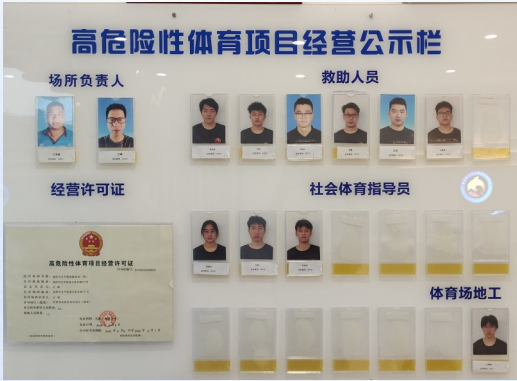
体育类培训机构人员公示栏。