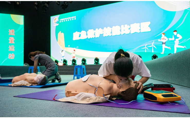
健康技能比赛现场，参赛队伍在做心肺复苏技能演示。

“健康家庭”创建活动自2018年发起以来，受到了全市广大群众的热烈欢迎和社会各界的广泛关注。各镇（街道）深入开展“六个一”健康素养提升活