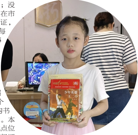
▲选好的新书，不用买单，就可以拿回家。

喜欢看书的市民，近期可以凭借书证抓紧到市购书中心自由选择新书；没有借书证的市民，也可以用身份证在市图书馆的微信公众号上办理借书证，非常方便。不过，需要注意的是，每张借书证每次最多可选择图书5本，所选图书每册价格不超过150元（学生教材、教辅、工具书、低幼粘贴图画书、音像制品、专业工具书等不在此活动范围内）。所选的图书，要符合市图书馆所有馆藏复本量要求，即少儿绘本不超过10个复本，其他品类不超过5个复本。大家选好书后可以直接到购书中心的前台鉴定图书是否符合要求。本次活动的借书时间为30天，还书地点位于市区溪滨路58号的市图书馆。归还后，这些图书将进入市图书馆正常馆藏，读者以后可以到市图书馆借阅。