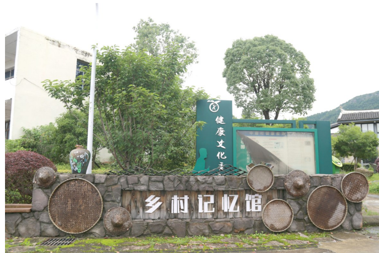
中扇新村乡村记忆馆