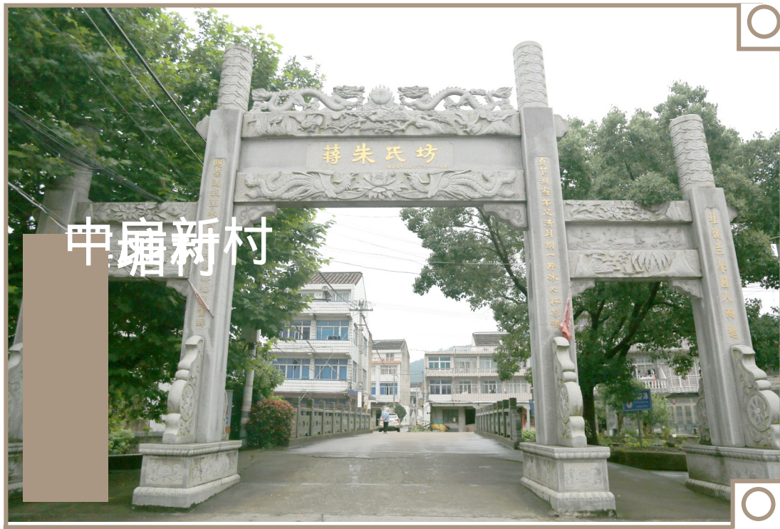
重建之蒋朱氏坊正面

厅堂有两层，二楼奉有文昌帝君、魁星、财神、土地等神像，两边还有节门一世祖至四世祖的神位。现在改作文化礼堂了，平时用一块可自动伸缩的幕布遮挡，改造成蒋氏讲堂。