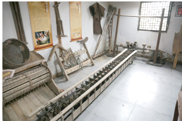
文化礼堂里的农具