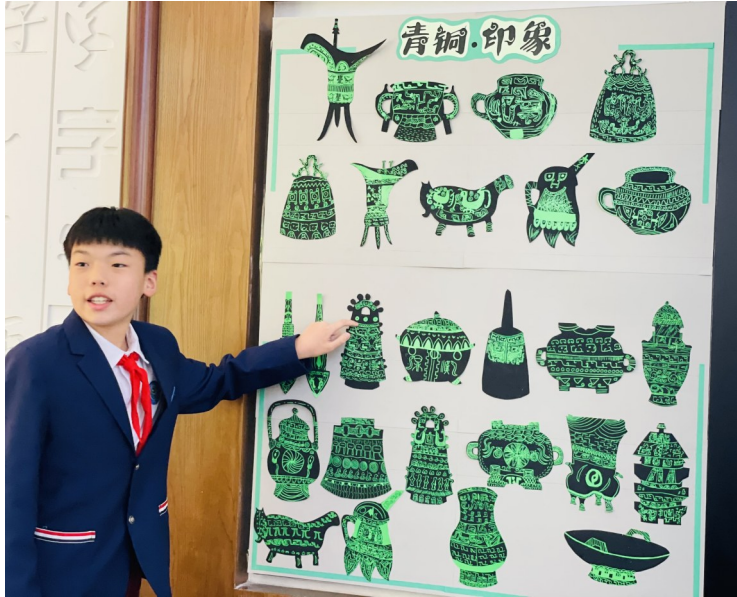
学生模仿创新的青铜器纹饰。

文物不仅是存在于博物馆里的展品，更是活跃在学生课堂中有趣的存在。市博物馆相关工作人员表示，今年 5·18国际博物馆日 的主题是 博物馆的力量，希望借此契