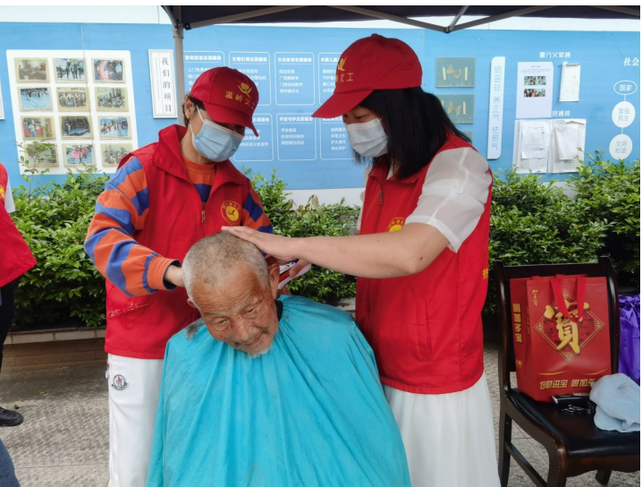
台胞义工给老人理发。

本报讯（记者郑灵芝文/图）“我志愿成为一名光荣的温岭慈善义工，尽我所能，发挥专长，关爱他人，奉献社会……”日前，在坞根镇迴龙村村部，30多名台胞齐聚一堂，宣誓加入温岭市慈善义工台胞服务队。这是台州市首支台胞义工队。