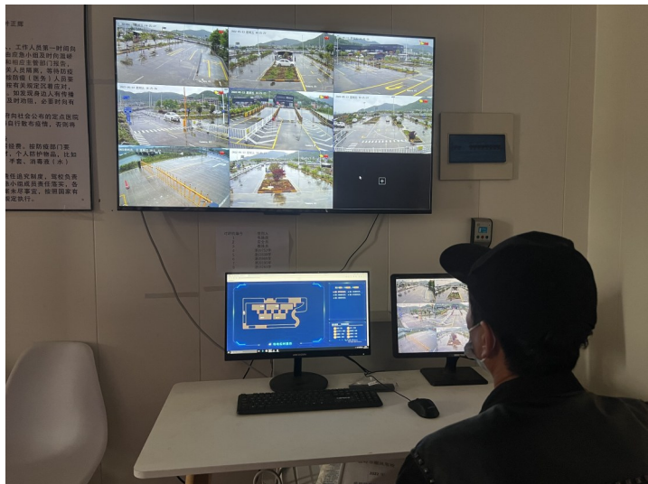
智能教学系统监控室。