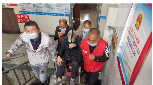
市计生协动员镇、村两级计生协积极助力疫情防控。图为石桥头镇计生协协会会员助力60岁以上老人新冠疫苗接种工作。