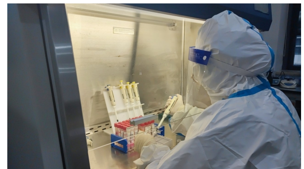
3月14日至3月20日,市第一人民医院检验科完成了2.6万余份核酸标本的检测,平均每天需检测3700多份。为了能快速出具检测结果,核酸检测工作人员数月以来加班加点,实验室内24小时灯火通明,已成为他们的工作常态。