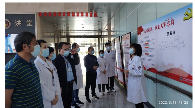
台州市中西医结合医院医共体发出疫情防控倡议书,号召党员同志们在疫情防控阻击战场上要坚决履行好工作职责,发挥好先锋模范作用。