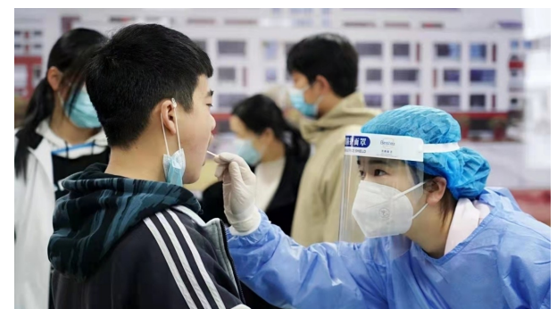
市第五人民医院第一时间组织核酸采样队伍,规范、高效地完成了城南中学、城南一小、城南二小、城南三小、城南镇中心幼儿园5所学校5000余名师生核酸采样工作。