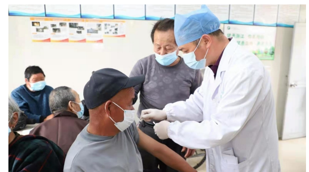
针对居住在山区养老院的行动不便老人,松门镇卫生院的医务人员把接种点移到了大山里,受到了老人们的欢迎。