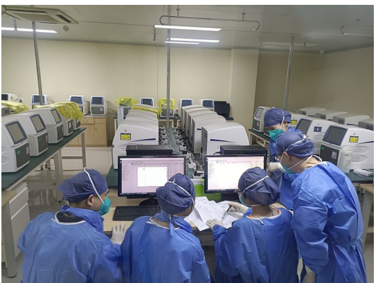
核酸检验员在做报告审核与发布。