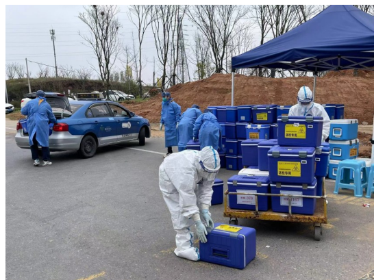
工作人员在接收标本,每天需要检测的标本量很大。