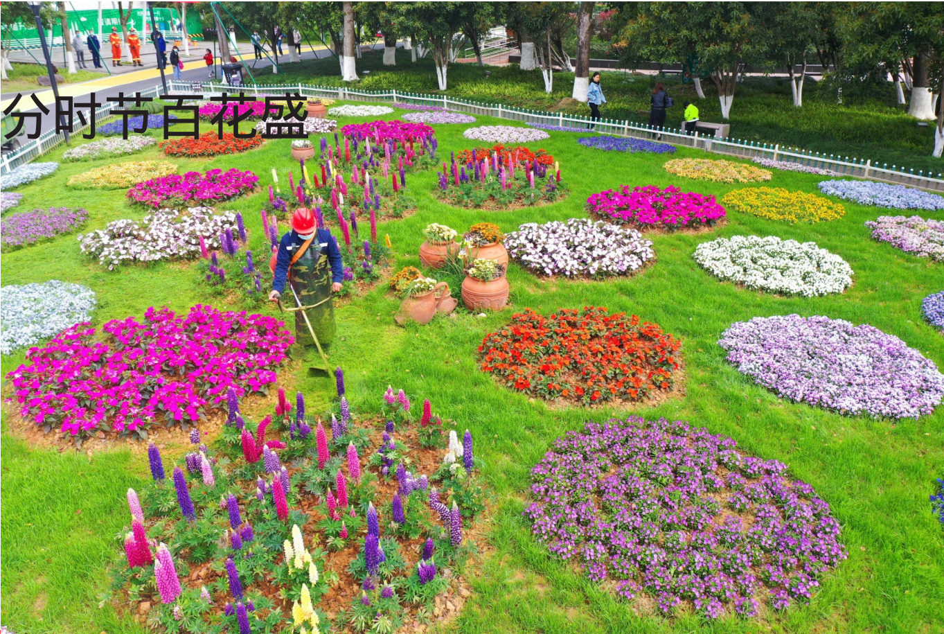
3月20日是农历二十四节气的“春分”。春分时节，百花盛开，市区锦屏公园内，羽扇豆艳丽多彩，三色堇花团锦簇，凤仙花姹紫嫣红，各色鲜花竞相绽放，争奇斗艳，一派春意盎然。图为3月19日，园林工人在锦屏公园花丛中除草。