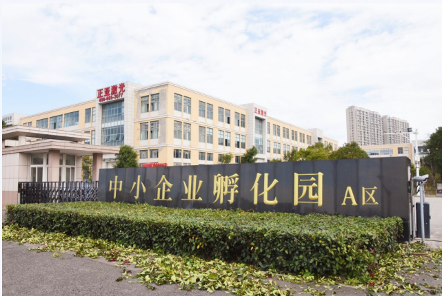
温岭东部中小企业孵化园。