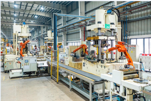
2月9日，浙江爱仕达股份有限公司恢复生产，员工正在赶制订单。