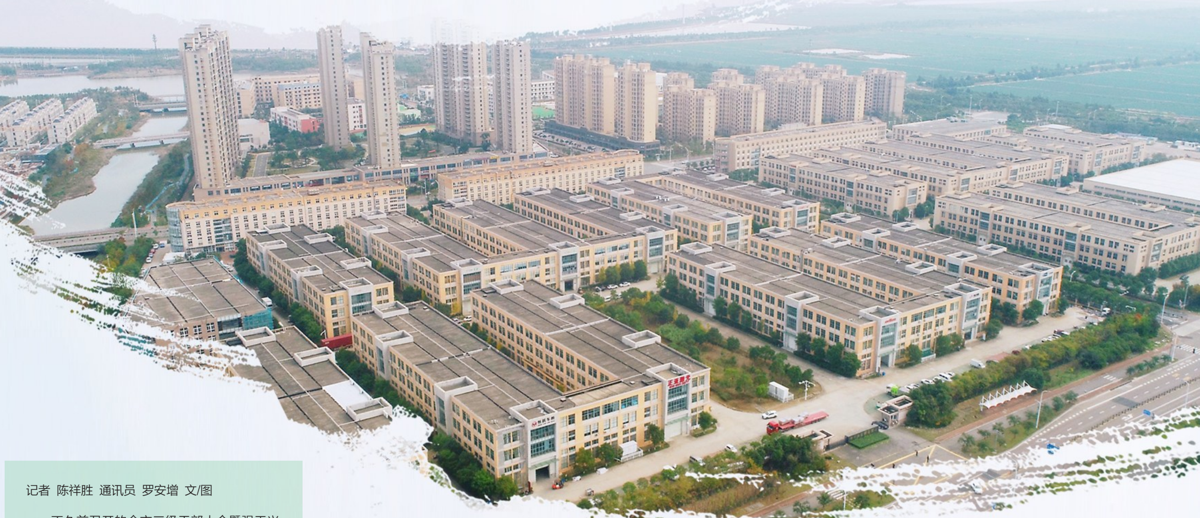
温岭东部中小企业孵化园航拍图。