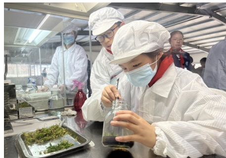
学生在工人的示范下亲自参与分拣瓶苗。