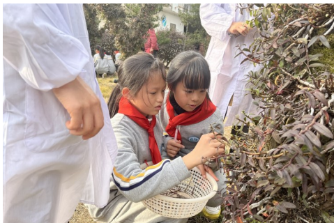
学生近距离观察仿野生状态的铁皮石斛。