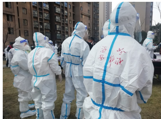
队员们身上的防护服，写着 温岭 两字。