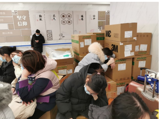
忙碌了一天，队员们都累瘫了，坐在椅子上休息。