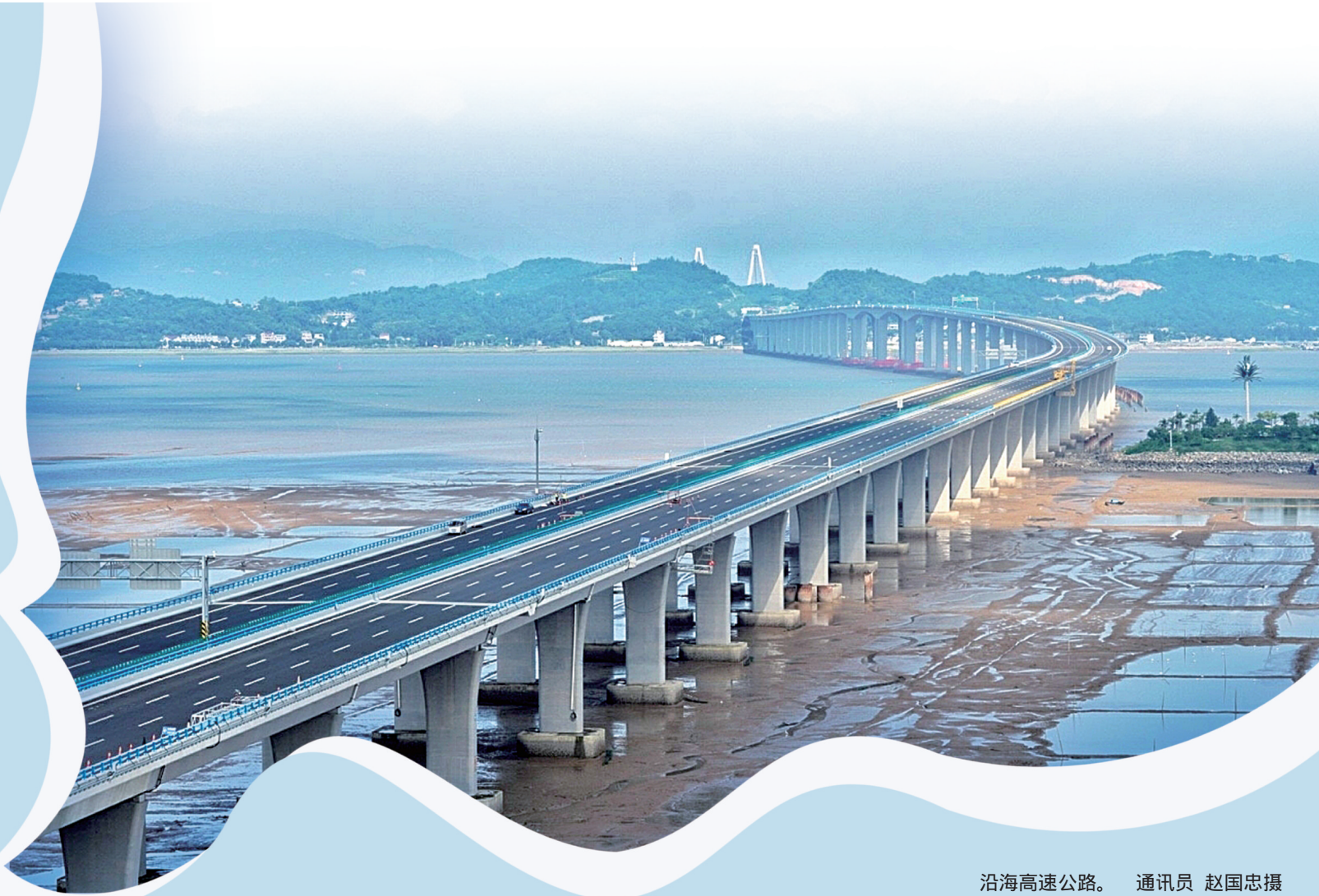
沿海高速公路。

纵横交错的城市立体交通网，正在塑造城市新格局。党的十九大以来的五年，是温岭交通跨越赶超、取得巨大成就的五年，一股股奋发有为的建设气概跃动起来，激起城市发展的新浪潮。 路畅天地新，五年来，温岭交通风云激荡，城乡面貌发生巨变，尤其是 十三五 期间，温岭交通基础设施呈现井喷式大幅度增长，累计完成综合交通投资约280亿元，是 十二五 期间的2.8倍，投资总额大幅领跑台州。 这五年来，也是温岭交通建设史上投资最大、完成项目最多、新增通车里程最多的五年。五年时间，完工通车12条高等级公路；新增一级及以上高等级公路100多公里。当前，杭台高铁即将通车，台州市域铁路S1线、两高温岭联络线等重大工程也在加快建设，极大地改善了温岭交通路网环境，温岭 外畅内序、互联互通 综合交通格局初步显现。 市委市政府高度重视，将交通作为 十三五 期间温岭经济社会发展的主要补短板领域去抓，社会的关注度和期望值都很高，对于我们交通部门来说，是压力，更是动力！市交通运输局党委书记、局长潘华荣用 挺不容易 这四个字概括了这五年来的工作，言简意赅，意味深长。 有激情，有感动，有破难攻坚的斗志，有苦尽甘来的喜悦，回眸过去五年，温岭交通，值得骄傲！