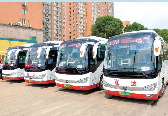
城乡公交新车。