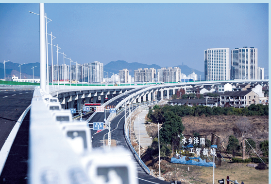
中央通道温岭段。 记者 庞辉斌摄