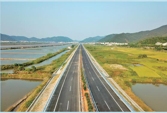
温岭泽国至玉环大麦屿疏港公路。