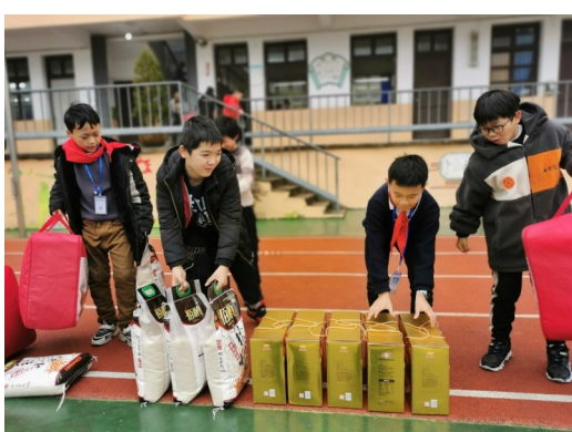
“留温过大年”暖心慰问民工子弟活动。