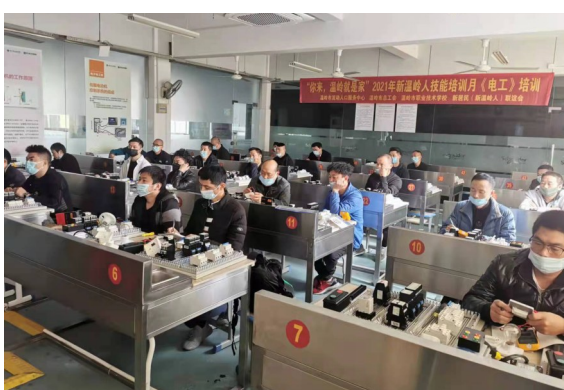
新温岭人技能培训。