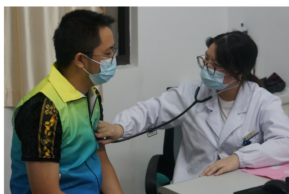
新温岭人参与“免费体检”活动。