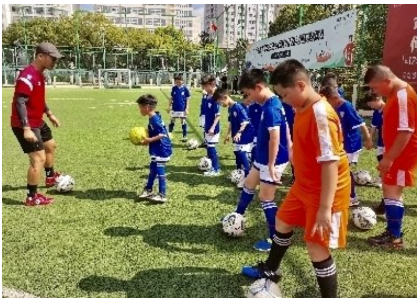
新温岭人子女“助梦课堂”活动。

下一步，该中心将以流动人口信息化管理手段为主要载体，进一步压实居住出租房屋房东、企业主和房屋中介等主体责任，建立完善流动人口信息排摸机制，逐步实现流动人口信息跨部门共享，不断夯实平安温岭建设基础。