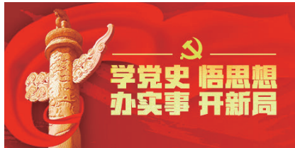
本报讯（通讯员杨鹏）10月13日，大溪镇退休干部党总支第一支部在

镇老干部活动中心开展 学党史，推动 共同富裕 欢度重阳活动，以退休不褪色，继续为大溪发展发光发热的特别形式，让自己的节日更有意义。