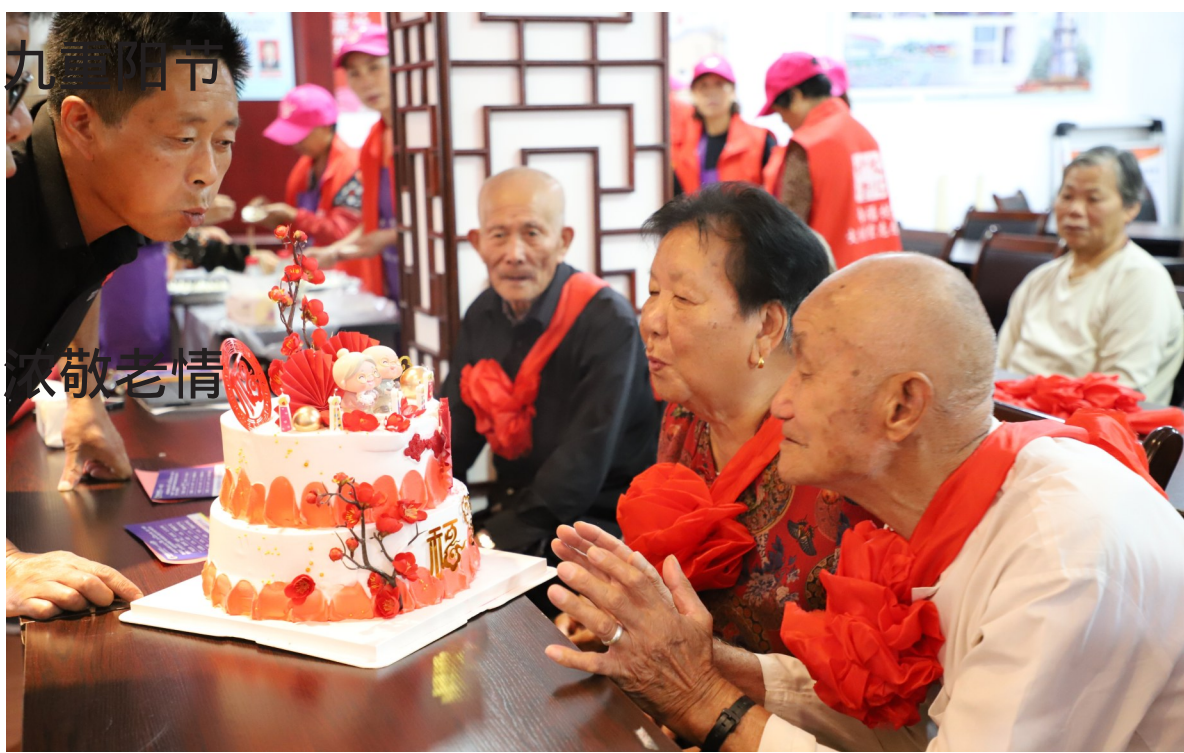
10月13日上午，松门镇幸福村文化礼堂里，村干部与老人一起吹灭祝寿蜡烛。当日，幸福村文化礼堂举行 九九重阳节，浓浓敬老情 敬老礼活动，村里的孩子给老人唱颂赞歌，文化礼堂志愿者为老人戴上大红花，给老人表演越剧，还给老人送上祝寿蛋糕和饺子，让老人开开心心过重阳。