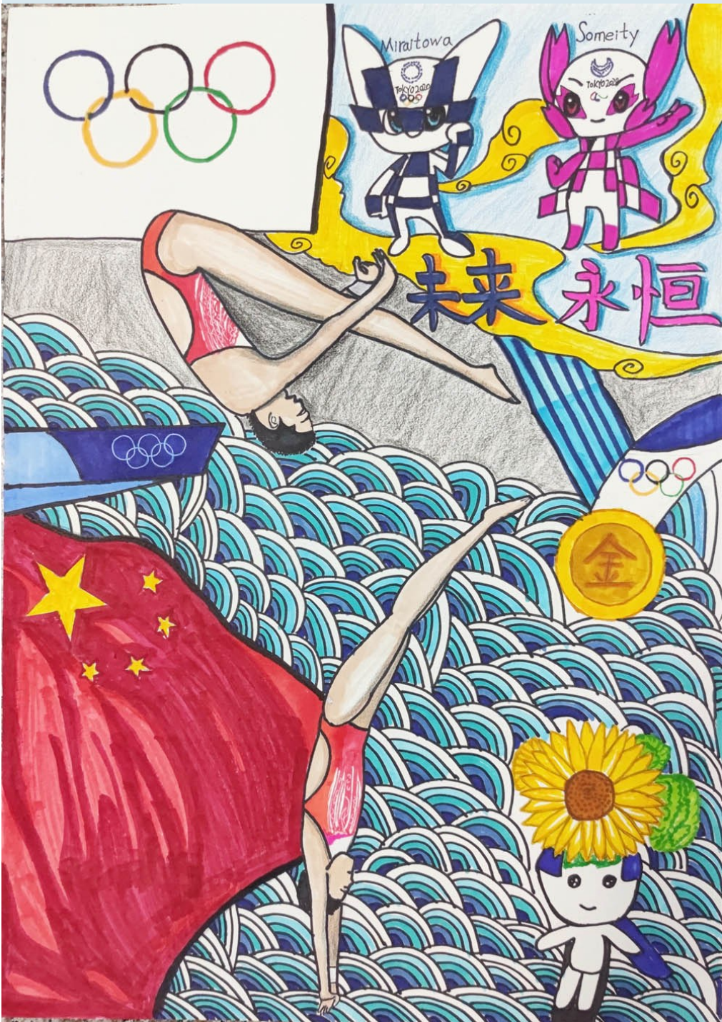
潘郎小学五(5)班 林锦湊 指导老师 孔雪虹(绘图)