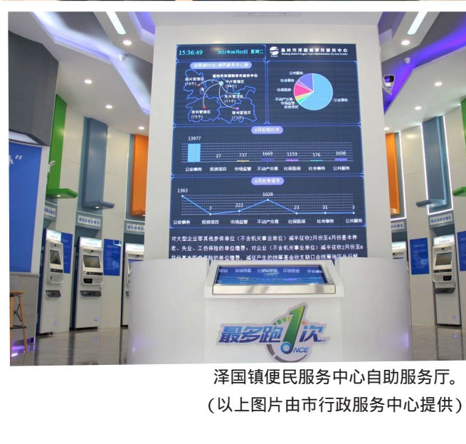
泽国镇便民服务中心自助服务厅。