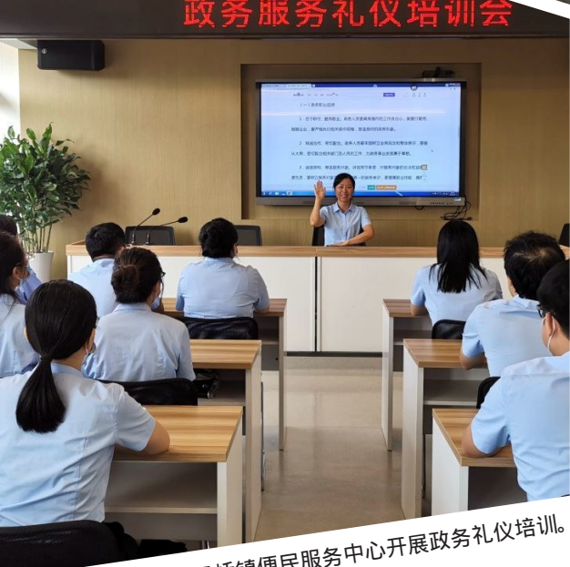
政务服务礼仪培训会