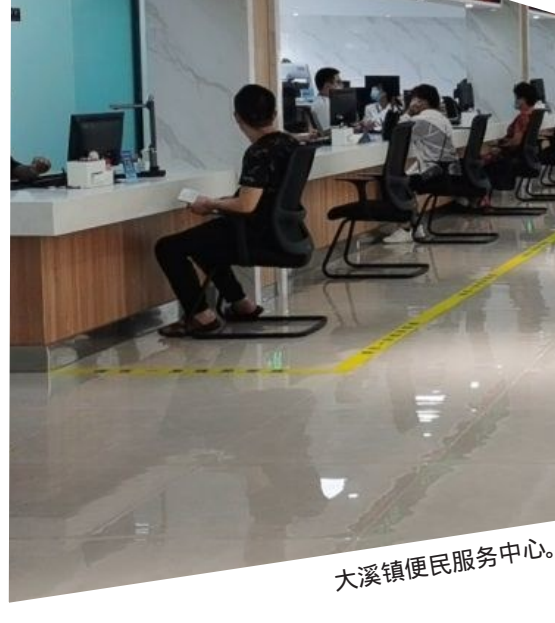
大溪镇便民服务中心。