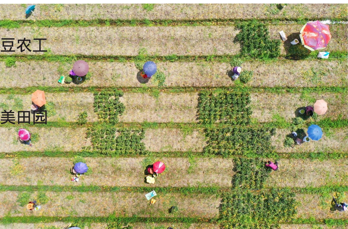
8月29日，石桥头镇上王村，蔬菜农业合作社正组织农工采摘今年第二季毛豆，农工们五颜六色的防晒伞和毛豆、整齐的田间沟畦，构成一幅色彩斑斓的田园画卷。