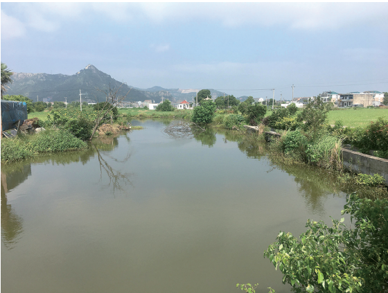
中库村水塘，远处为白峰山。