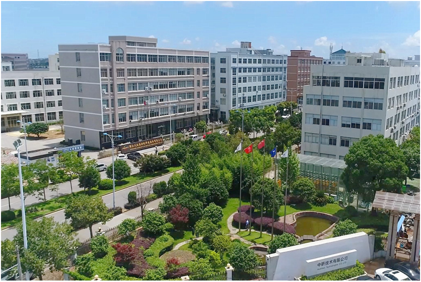
箬横汽配工业园区。

台州市达嘉新型墙体材料有限公司项目负责人介绍，在项目未落地前，这里的老旧厂房不光建筑凌乱，且存在一定的安全隐患。现在我们把这里整片的用地都集中起来，一体化提升改造，建成具有现代数字生