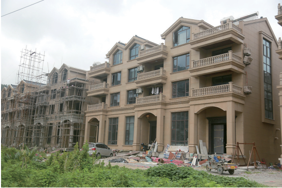
湖南村城中村改造项目。