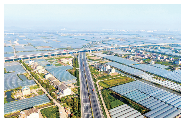
G228与沿海高速交会处

有好路，百姓出行更方便；有好路，产业发展更优化。下一步，我市将持续推进“四好农村路”建设，最大限度激发“美丽公路+”活力，为乡村振兴提速。