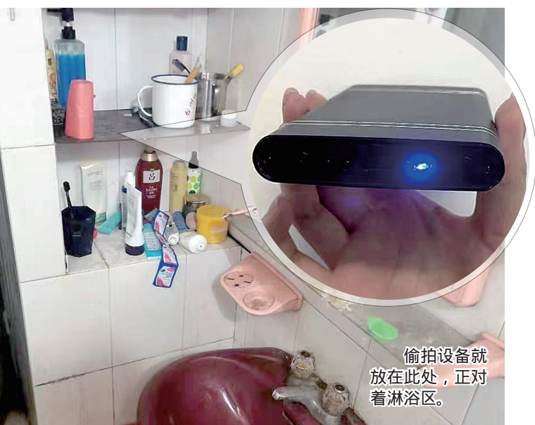
偷拍设备就放在此处，正对着淋浴区。

本报讯（通讯员吴冷欣）近日，泽国派出所接到一名年轻女孩的报警电话，称在家中浴室发现了带摄像头的充电宝，怀疑自己被人偷拍了。