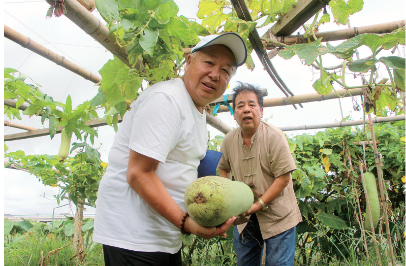
五六十斤重的长冬瓜，要两个人才能抬起。