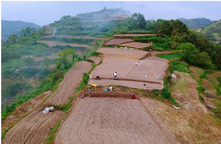
种植小土豆，走上致富路。

俗话说：十里坞根岭，冷饭挂头颈。被山海包围的红山村为何能打开土豆销路，让全村甚至全镇农民靠种植小土豆走上致富道路呢？说起这一改变的发生，当