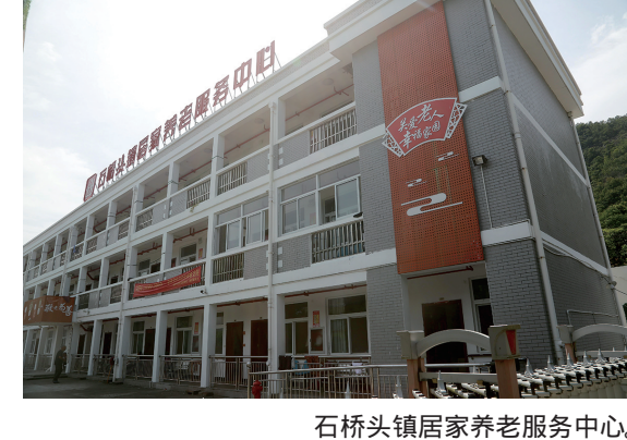
石桥头镇居家养老服务中心。