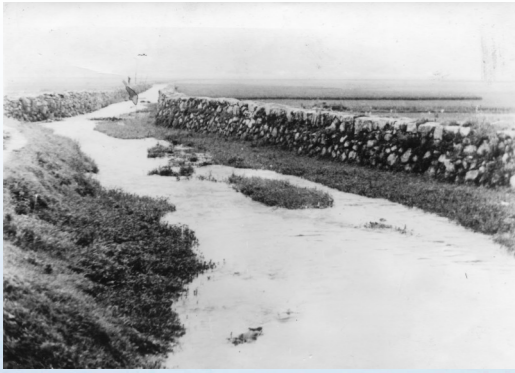
坞根游击大队洋皇岙桥溪三次反军事围剿阻击战旧址。

辟革命工作。西区农民武装斗争的星星之火开始燃起，并迅速扩散，奏响了中共温岭革命史的壮丽乐章。