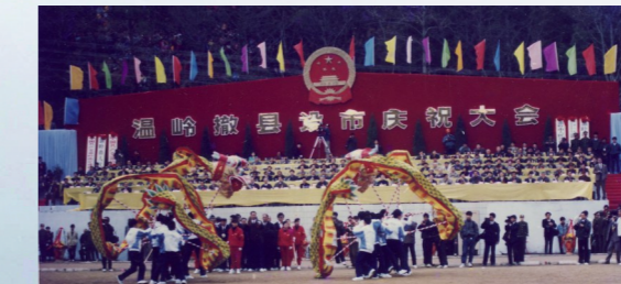
温岭撤县设市庆祝大会。

2020年，温岭地区生产总值1136.87亿元，是1978年的292倍；财政总收入达118.98亿元，是1978年的659倍，这些以何速度不断刷新数据交卷成就了温岭改革开放四十多年百花争艳的立体画卷，而隐藏在这些人数据背后的生动实践与不懈探索，才真正诠释了这座城市的核心之能和发展之源。当前，在向着社会主义现代化新征程大步迈进和高质量发展建设共同富裕示范区的新阶段，温岭市委再一次高屋建瓴，提出争当新时代“重要窗口、排头兵、奋力打造新时代民营经济高质量发展强市、宜业宜居现代化中等城市、县域治理现代化标杆市”的战略部署。回眸百年，温岭从封闭走向开放，从落后走向小康，每一步无不凝聚着奋斗与信仰浇筑的红色印迹，无不高扬着信念和初心支起的红色引领。新时代、新征程，温岭上下再次凝心聚力，继续秉持初心和匠心，在习近平新时代中国特色社会主义思想的指引下，以新时代“敢闯干”改革精神续写“八八战略”温岭新篇章。