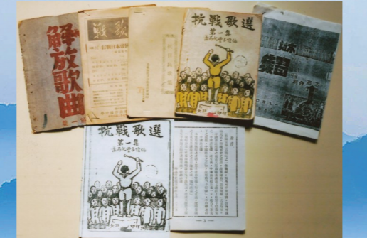
青联团编印的《抗战歌选》等资料。