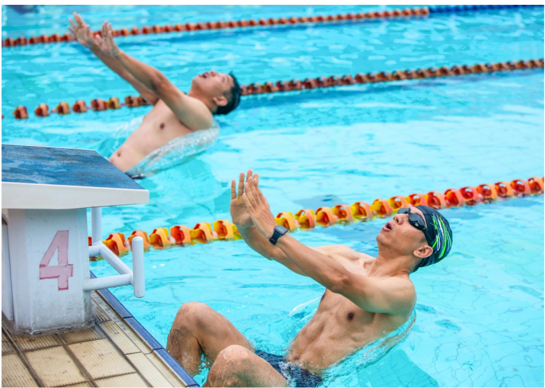
参加仰泳的选手们蓄势待发。