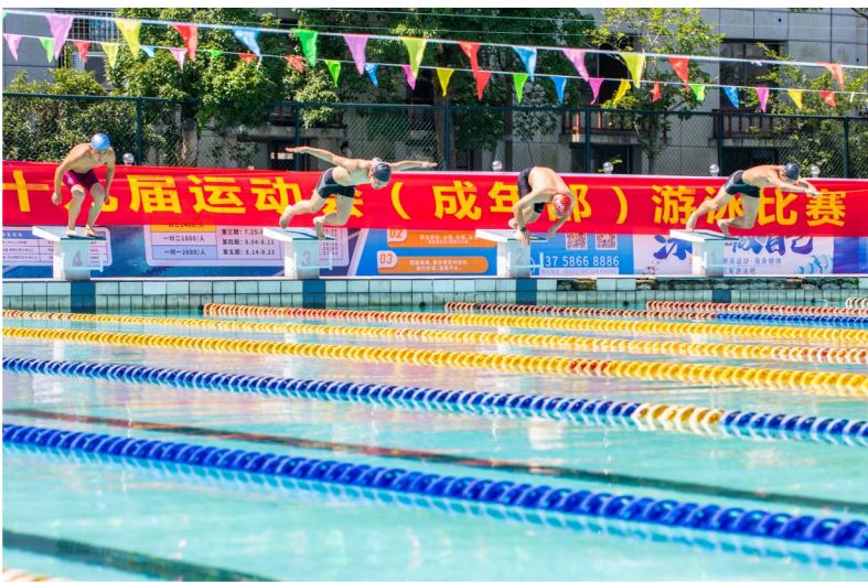
温岭市第十九届运动会（成年部）游泳比赛在市体育中心举行。