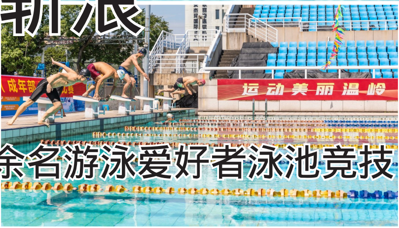
随着裁判长一声发令枪响，选手们跃入水中。