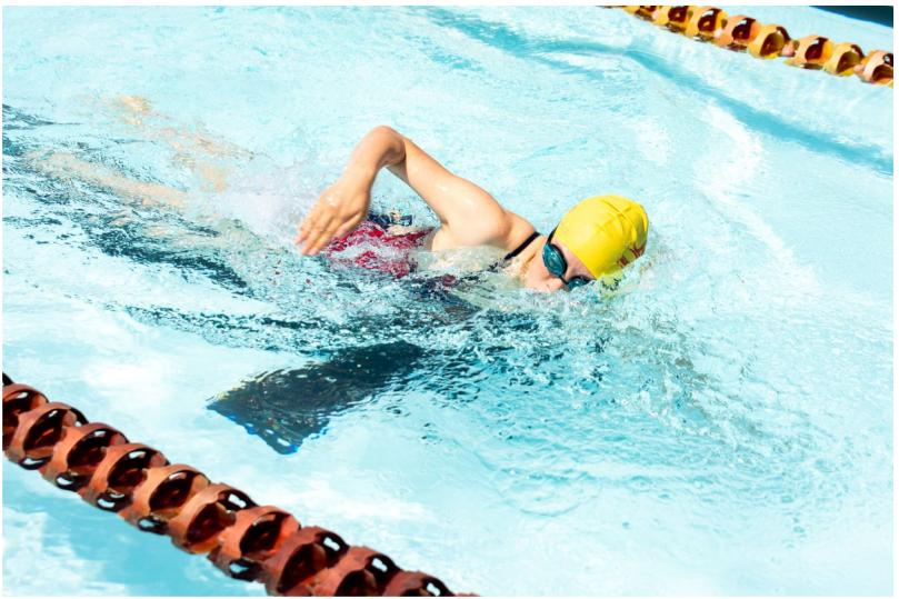
竞赛项目包含50米、100米自由泳，蛙泳，仰泳，蝶泳，4×50米自由泳接力。