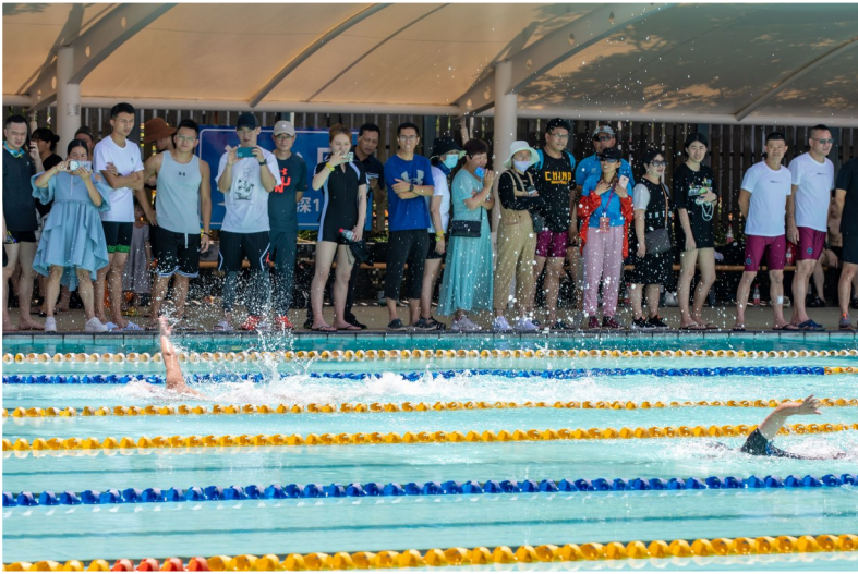
现场欢呼声、呐喊声不绝于耳。