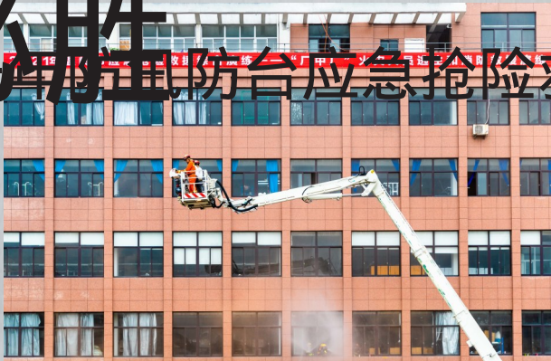
被困人员正在通过消防云梯进行安全逃生