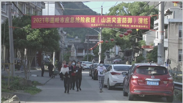
山洪灾害防御演练

位于城北街道横塘鞋业智造产业园的一鞋企因在台风前赶工，超负荷作业导致电线短路起火。该企业立即按照火灾应急预案迅速组织人员逃生，开展先期灭火自救处置，但仍有5名员工被困火场。此时，消防、应急、城北街道等单位人员相继赶到现场，并成立现场应急救援临时指挥部实施灭火救援