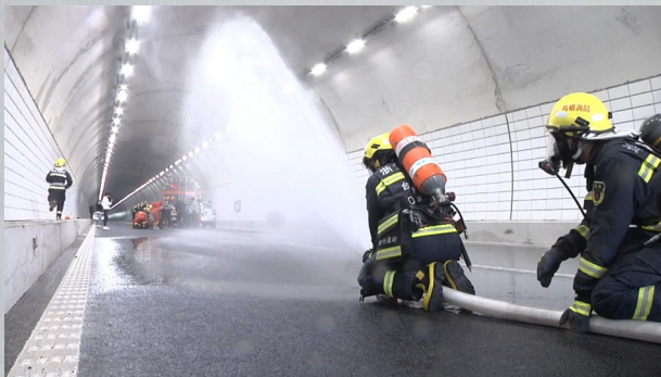
危化品运输车隧道内危化品泄漏事故应急处置演练