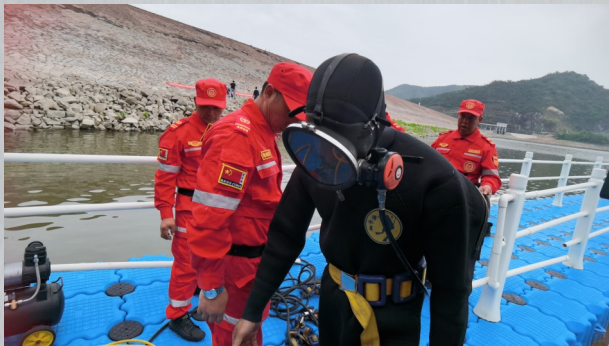
水库放水涵洞阻塞抢险演练