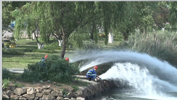
参演人员正在开展城市内涝强排