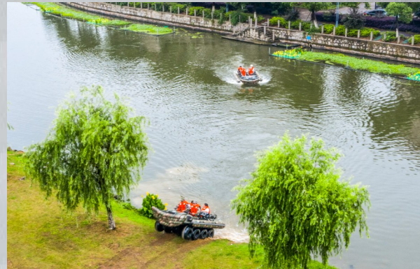
救援人员利用水陆两栖车对被困人员进行救援