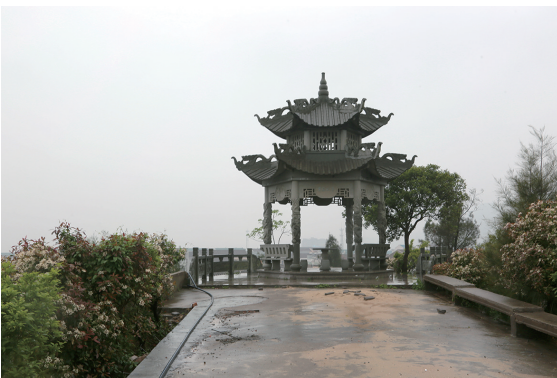
翠屏山上幸福明亭。