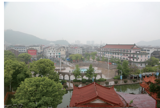
翠屏山上俯瞰翠屏文化广场。