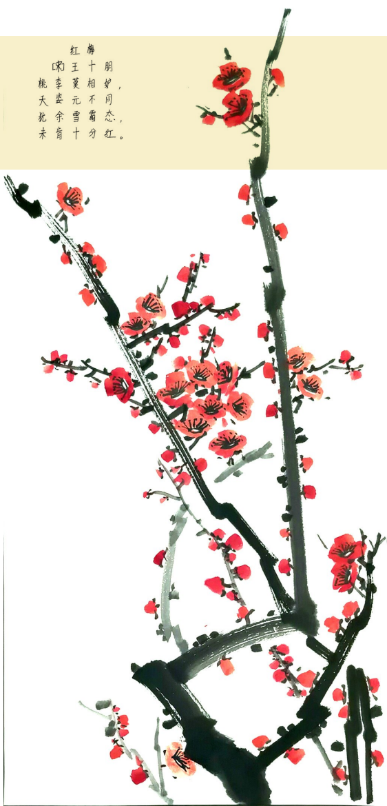
泽国二小四(4)班 叶明泽 指导老师 郑笑平