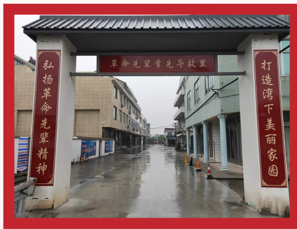
湾下村特意打造了李先导故居的村牌。

湾下村特意打造了李先导故居的村牌，还在文化礼堂内用文化墙展现李先导革命时期的奋斗事迹，让他的革命精神代代相传，永放光芒。