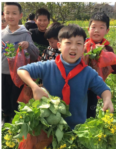
学生在基地采收自己种的蔬菜。

本报讯（记者江潇扬 通讯员谢声奎）香喷喷的香菇炒肉，鲜嫩可口的萝卜汤，红彤彤的番茄炒蛋 学生们制作的一道道美味佳肴，令人胃口大开。近日，潘郎小学开展了 田园魅力 尚志演绎 劳动教育主题系列之厨艺大比拼活动。