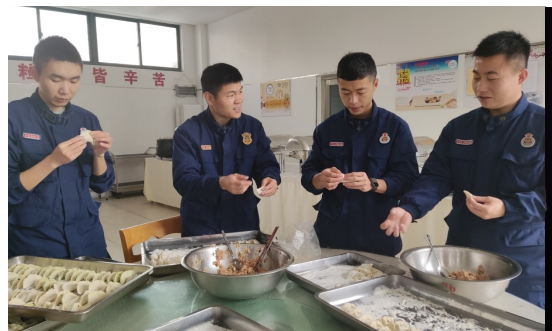
春节期间，消防员包饺子。