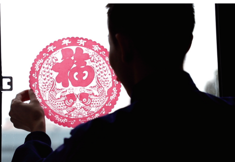
大年三十，消防员贴窗花。