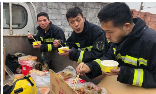
春节期间，消防员灭火后在现场吃工作餐。