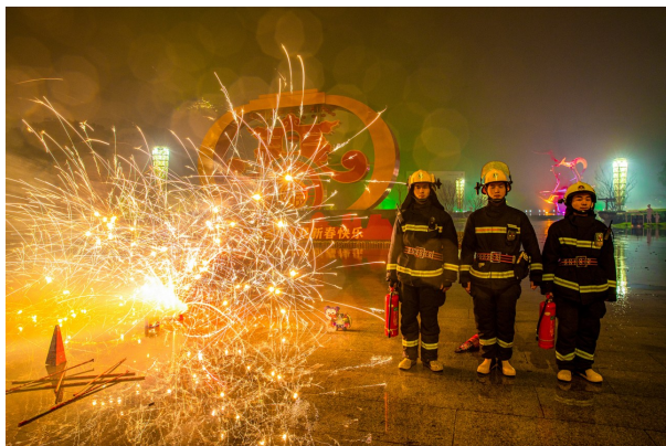
春节期间，消防员护航保平安。

小时候，乡愁是一张窄窄的船票，我在这头，故乡在那头；现如今，乡愁是守护着万家灯火，这头是你的平安，那头即是我的坚守。春节，是万家团圆的日子。但有这样一群“逆行者”，他们放弃了与家人团聚的机会，默默守护着一方平安，他们就是消防员。来自五湖四海的他们，将浓浓的乡愁化作守护千家万户的责任与担当。