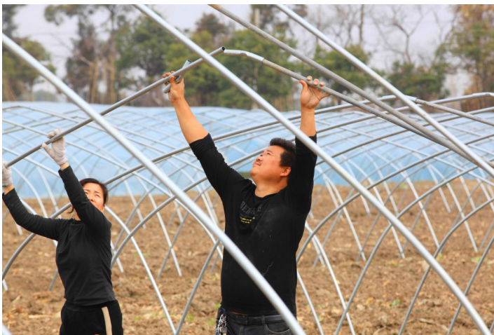
钢管户用套子将左右两根钢管连接起来。