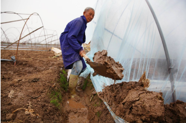
在大棚两端压上厚厚的泥块。