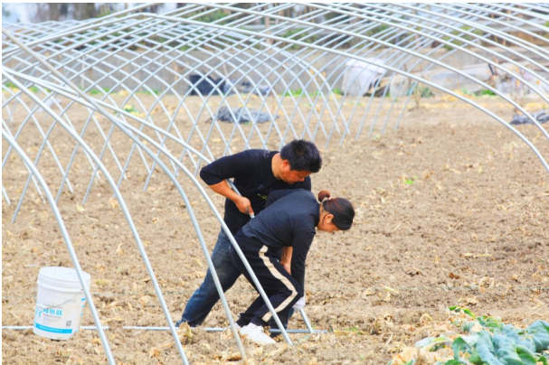
插钢管需要两人配合。