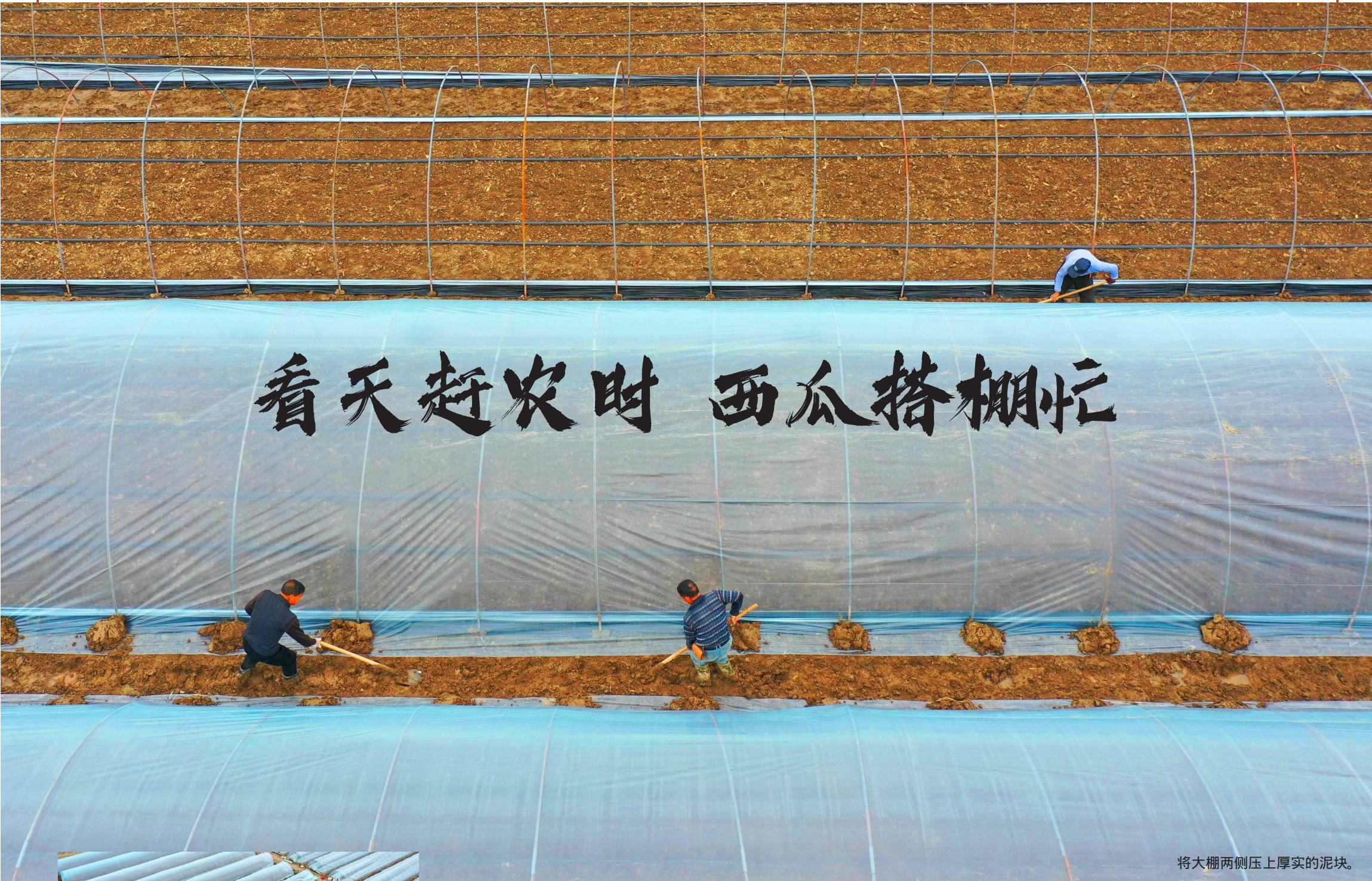
将大棚两侧压上厚实的泥块。