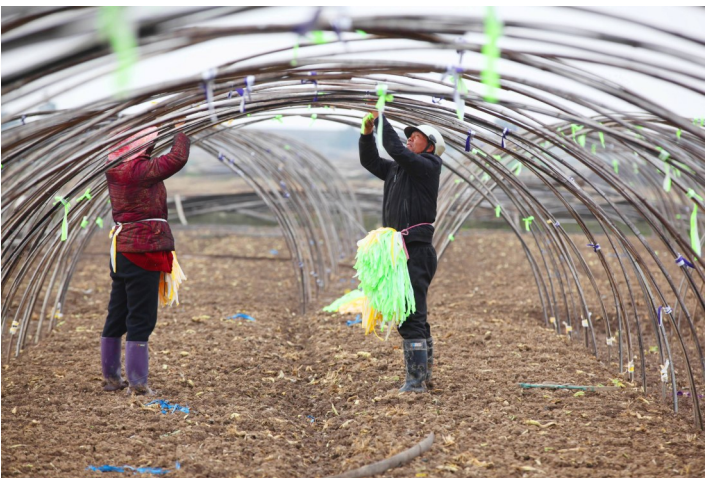
竹棚西瓜户捆绑加固毛竹棚架。