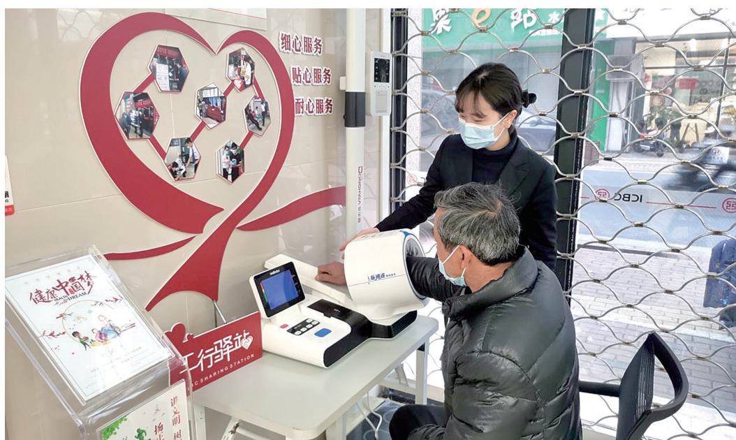
新河支行 银医 驿站一角。

就在2021年前一天，万寿路上的工行温岭支行在经过75天的改造装修后重新开业，成为台州市首家智慧人文主题银行，同时为支行布局