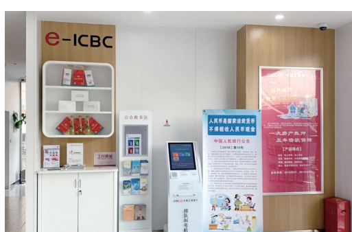
东辉支行 政务 驿站一角。