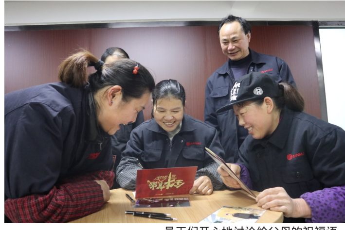
员工们开心地讨论给父母的祝福语。